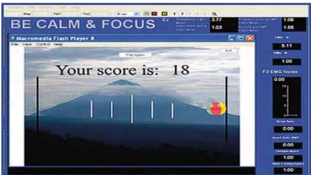
شکل ۱: تکلیف به‌کاررفته در این پژوهش

روش اجرا: ابتدا از آزمودنی‌ها خواسته شد روبه روی لپ‌تاپ نشسته تا به‌صورت اجمالی توضیحاتی در مورد تکلیف React Traking Soccer و نحوه ثبت EEG برای آن‌ها بازگو شود. سپس آزمودنی به مدت یک دقیقه بازی مذکور را تمرین می‌کرد. انجام آزمون بدین شیوه بود که از آزمودنی خواسته می‌شد، پس از شروع و حرکت توپ به سمت چپ یا راست، با حرکت دادن ماوس در جهت مخالف، مبادرت به حفظ تعادل توپ و جلوگیری از خروج توپ از خط‌های هدف نماید. پس از حصول اطمینان از اینکه آزمودنی به‌طور کامل نحوه انجام چالش شناختی را آموخته است، صفحه لپ‌تاپ به صفحه سفید تغییر داده می‌شد و از او می‌خواستیم