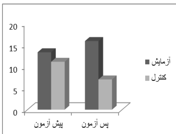
شکل ۲. مقایسه میانگین نمرات شاخص شایستگی ادراک شده دو گروه